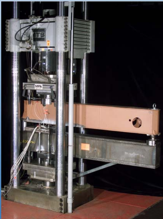
Dauerschwingversuch an Kranbauteilen