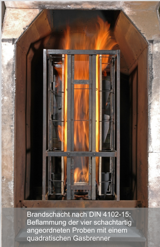
Brandschacht nach DIN 4102-15: Beflammung der vier schachtartig angeordneten Proben mit einem quadratischen Gasbrenner