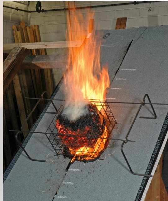
Prüfung einer Bedachung auf Widerstandsfähigkeit gegen Flugfeuer und strahlende Wärme nach DIN 4102-7 und DIN CEN/TS 1187