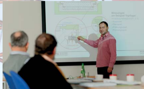
Schulung von Fachkräften für Lager im Bauwesen