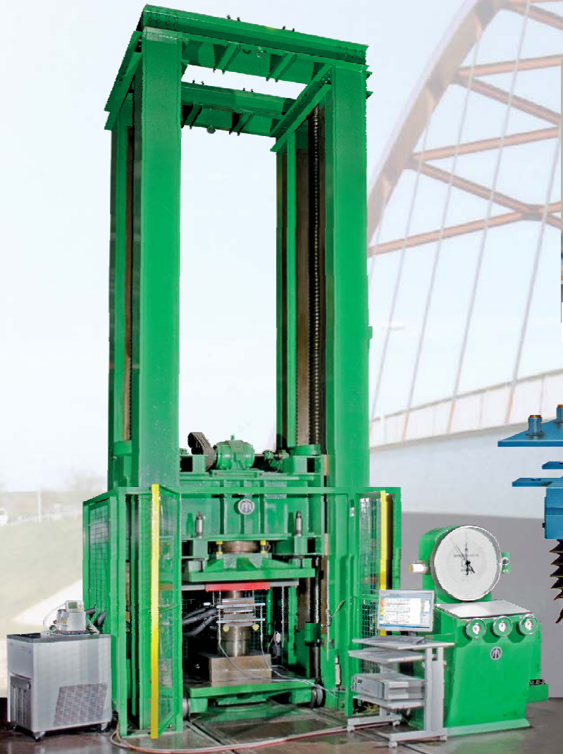
6000 kN Druckprüfmaschine